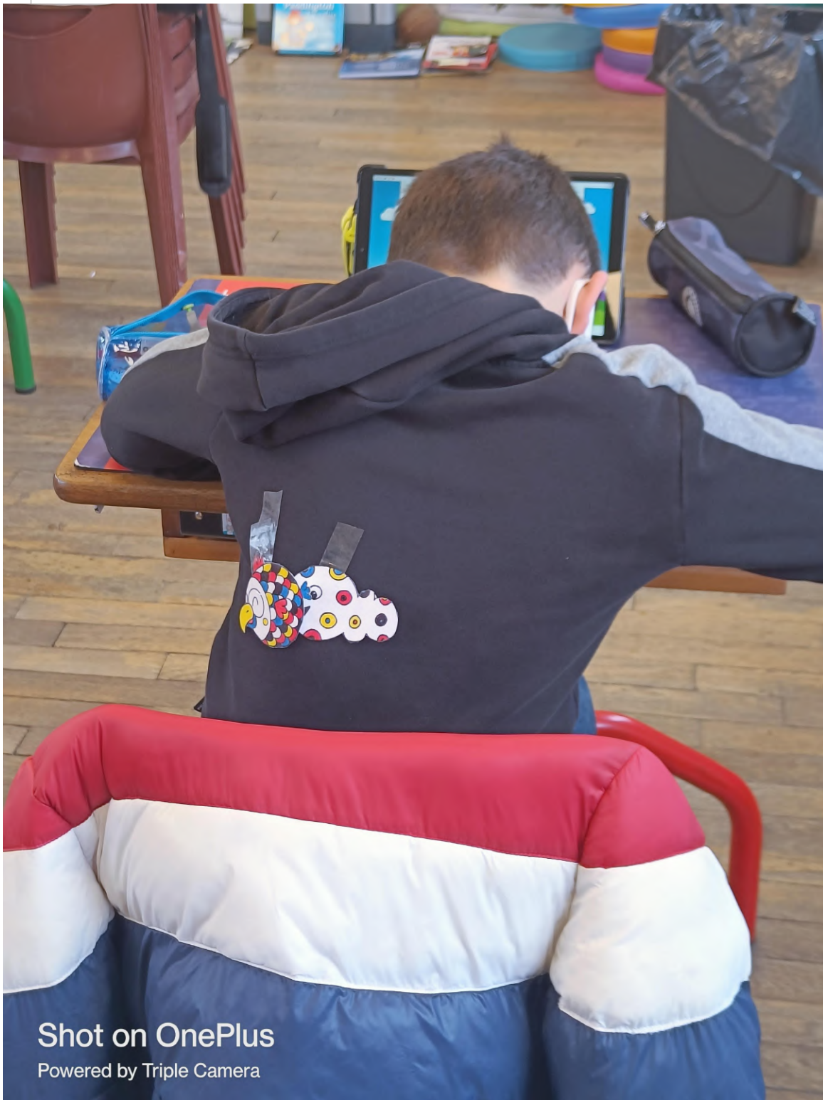
Shot on OnePlus Powered by Triple Camera