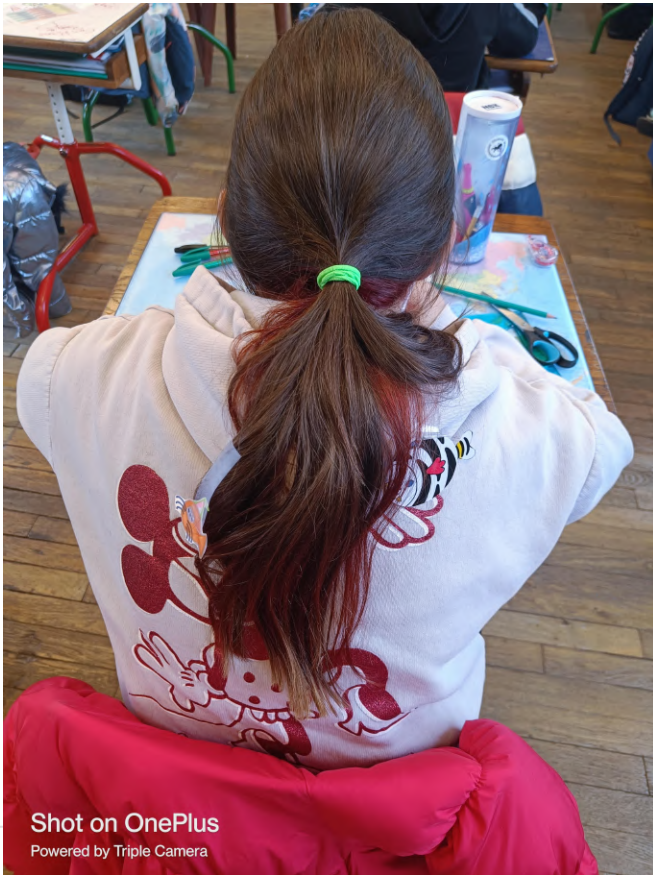
Shot on OnePlus Powered by Triple Camera