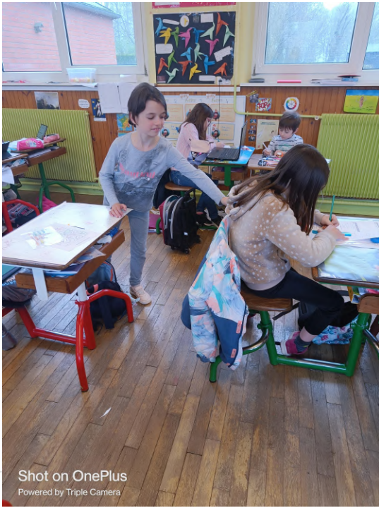
Shot on OnePlus Powered by Triple Camera